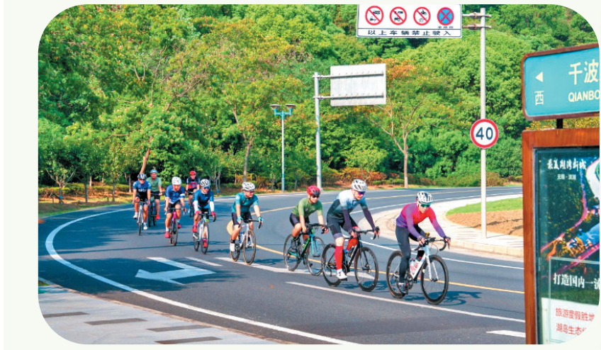
(上接第1版)让游玩无锡成为不少海外游客“说走就走”的轻松之选。

开拓海外市场的创新之举，助推无锡知名度的进一步打开。今年3月，太湖鼋头渚樱花节开幕式首次走出国门，在匈牙利布达佩斯开幕，将江南之美远播海外；5月，市文旅集团在泰国、日本开展国际推广活动，“一带一路”名家太湖画展通过40多幅精品画作呈现太湖艺术的演变历程，立足大阪世博会的全球舞台，全新打造的“太湖雅集”高端对话等，更是向世界讲述着“无锡故事”。