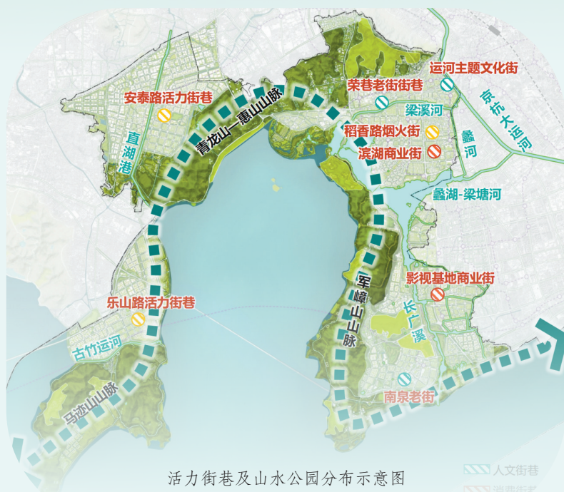
活力街巷及山水公园分布示意图

“山水融城”凸显生态优势与特色魅力。坚持生态优先、绿色发展,以“串珠成链、联网融合”为原则,推进沿山、临湖地区公共空间建设与生态价值转化,构建连续开放、功能复合的蓝绿网络体系,打造宜居、活力、开放、共享的滨水城市客厅。