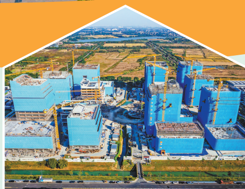
未来产业研发制造社区建设现场