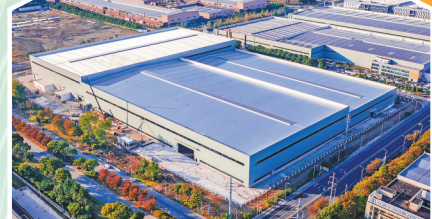
德力佳三期项目建设现场