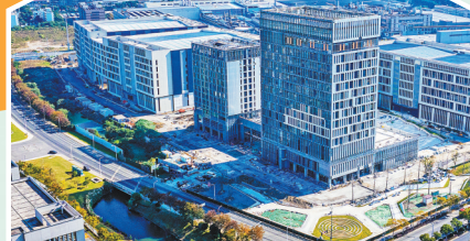
中欧智能装备产业园南区项目现场