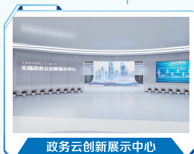
政务云创新展示中心