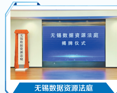
无锡数据资源法庭