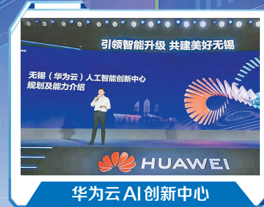
华为云 AI 创新中心