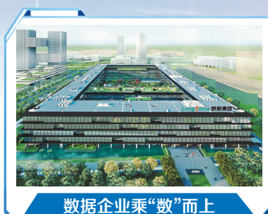
数据企业乘“数”而上