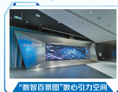
“数智百景图”数心引力空间