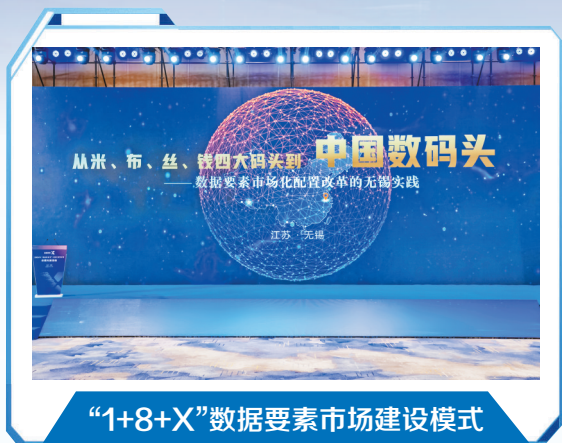
“1+8+X”数据要素市场建设模式