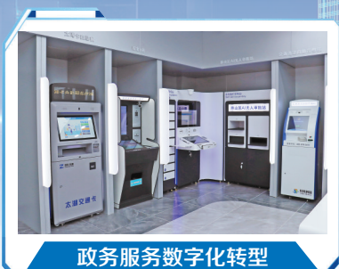
政务服务数字化转型