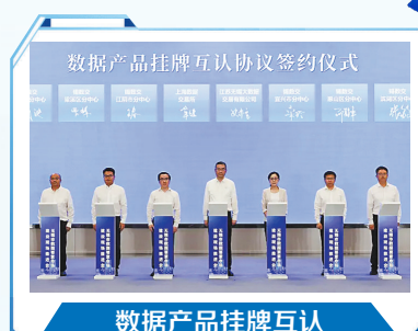
数据产品挂牌互认