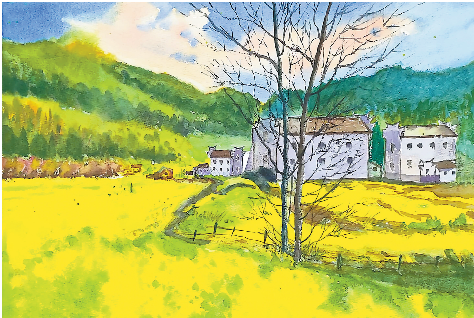
田埂上的春(水彩画)

我就这样老了,还只有六十出头,就成了别人眼里的“老人家”。我现在也想通了,被人“看老”也没那么重要,早早享受社会和年轻人的呵护,也许是求之不得的好事呢。(阮红松)