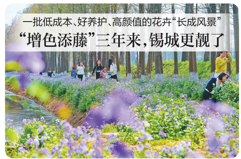
一批低成本、好养护、高颜值的花卉“长成风景” “增色添藤”三年来,锡城更靓了

“文学要映照时代。”为创作长篇报告文学《筑梦路上——无锡地铁发展纪实》,包松林连续5年戴上安全帽深入隧道,采访180多位地铁建设者,用80多万字记录下盾构机掘进、深夜换轨、高温焊接等108个鲜活瞬间。据统计,近年来,无锡作家累计出版各类文学著作350余部,在各级各类平台发表文学作品5000余篇,从创作“高原”稳步迈向文学“高峰”。无锡市作协主席黑陶表示,(下转第2版)