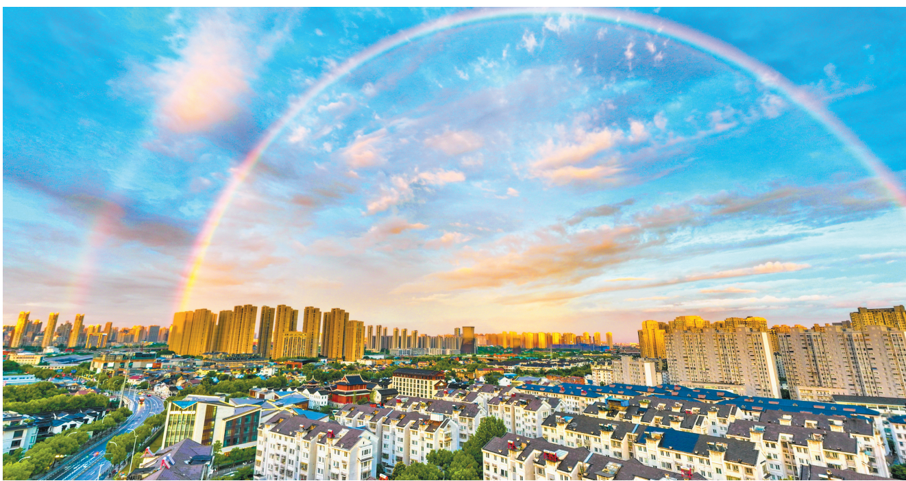
昨天傍晚久雨乍晴，两道彩虹高悬在锡城上空，瑰丽景象吸引了众多市民驻足观看。