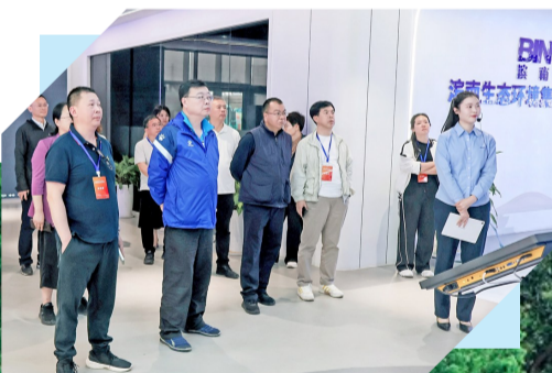
媒体团来到滨南生态环境集团调研。