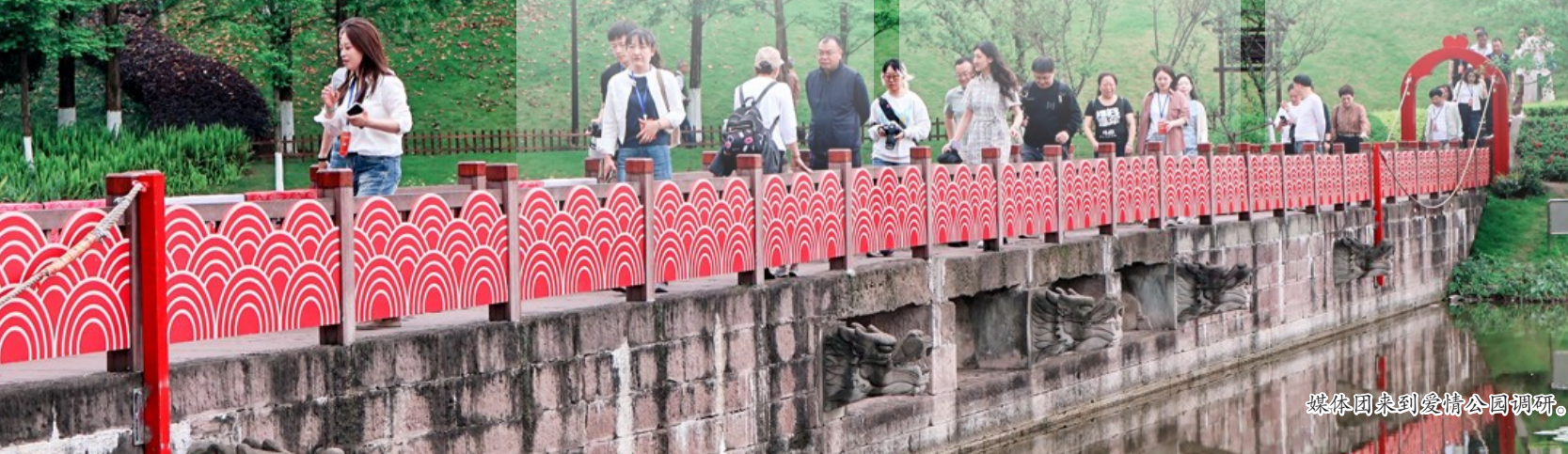
媒体团来到爱情公园调研。