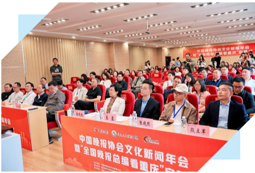
在人文科技学院举办的启幕式。