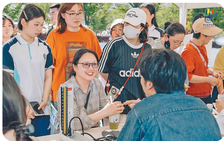
获金奖9项,在中华人民共和国第三届职业技能大赛中获金牌2项。活动现场,正式公布了2025年世界职业院校技能大赛总决赛争夺赛金奖名单、中华人民共和国第三届职业技能大赛获奖名单以及无锡市高校示范

5月16日,2026年无锡市职业教育活动周暨职业院校办学成果展示活动在万象城西侧广场举行。本次活动主题为“一技在手,一生无忧”。 2025年,在职业院校的学习和实践中,在职业教育人的不断奋斗与探索中,我市职业教育硕果累累,成绩满满。《无锡市职业教育条例》正式施行;无锡职业技术大学获批设立并招生;无锡职业技术大学、江苏信息职业技术学院入选国家“双高计划”建设院校。全市还新增人工智能技术应用、智慧健康养老服务与管理等五年制高职专业点7个,低空安全与技术高职专业30个,人工智能工程技术等职业本科专业6个。更值得关注的是,在江苏省职业院校技能大赛(中职组)中,无锡学生获得一等奖26项,位列全省第三。全市职业院校在2025年世界职业院校技能大赛总决赛争夺赛中