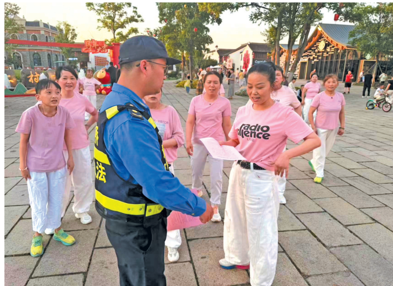
高考临近,城管部门开展“禁噪”专项行动,通过入户宣传、加大巡查力度等方式,引导商户减少噪声,严查考点周边秩序,全力为考生营造安静、有序的备考环境。

据了解,今后,Z·Pilot×智元玩家基地将打造社群活动专区,承载科技玩家交流、机器人体验日、AI工具分享、亲子科技活动、品牌共创与产品体验反馈等功能。与此同时,基地还将聚焦OPC创业生态,引入OPC产品展示,让独立创业者低门槛对接市场、验证产品,助力科创梦想落地生花。(陈钰洁)